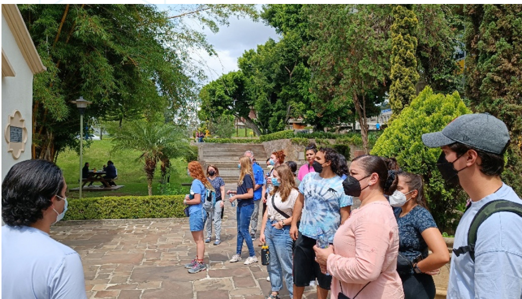
Figura 14. Estudiantes de Regis University durante un recorrido por el Campus San Francisco de Borja, S. J. (1).