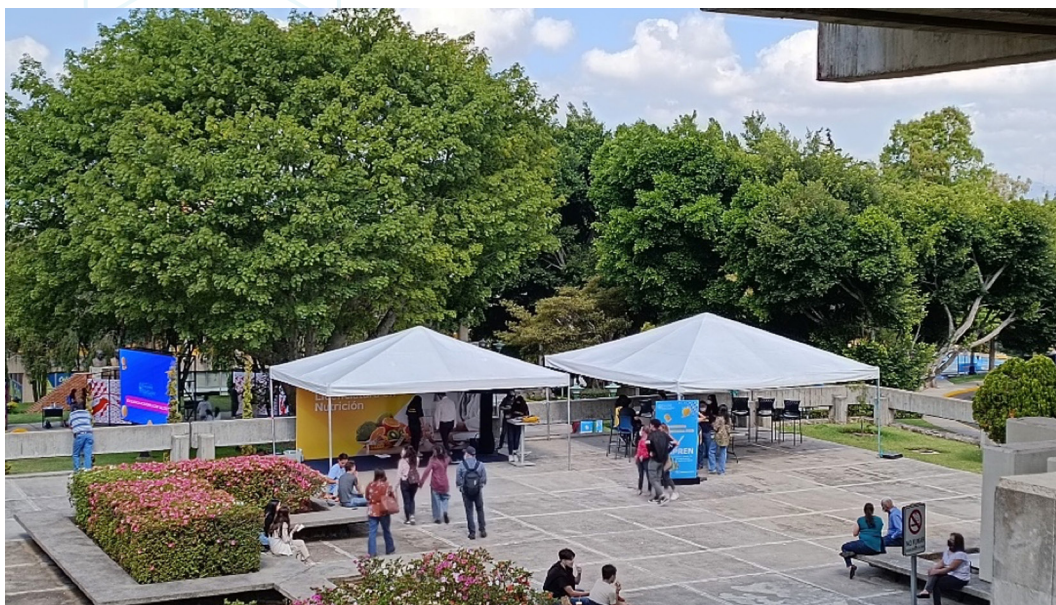
Figura 8. Stands informativos de la Facultad de Ciencias de la Salud (1).