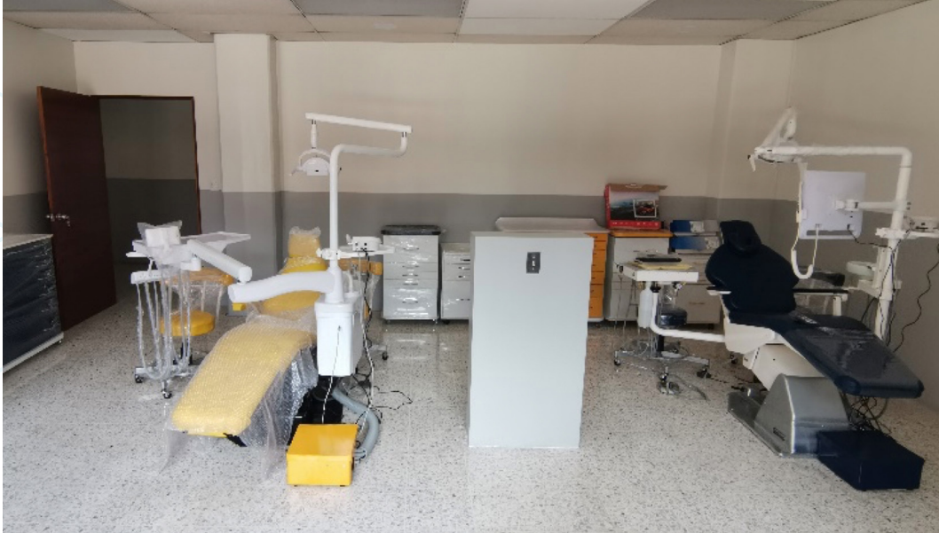
Figura 22. Avances en la construcción de espacios para atención de pacientes en diferentes especialidades (1).