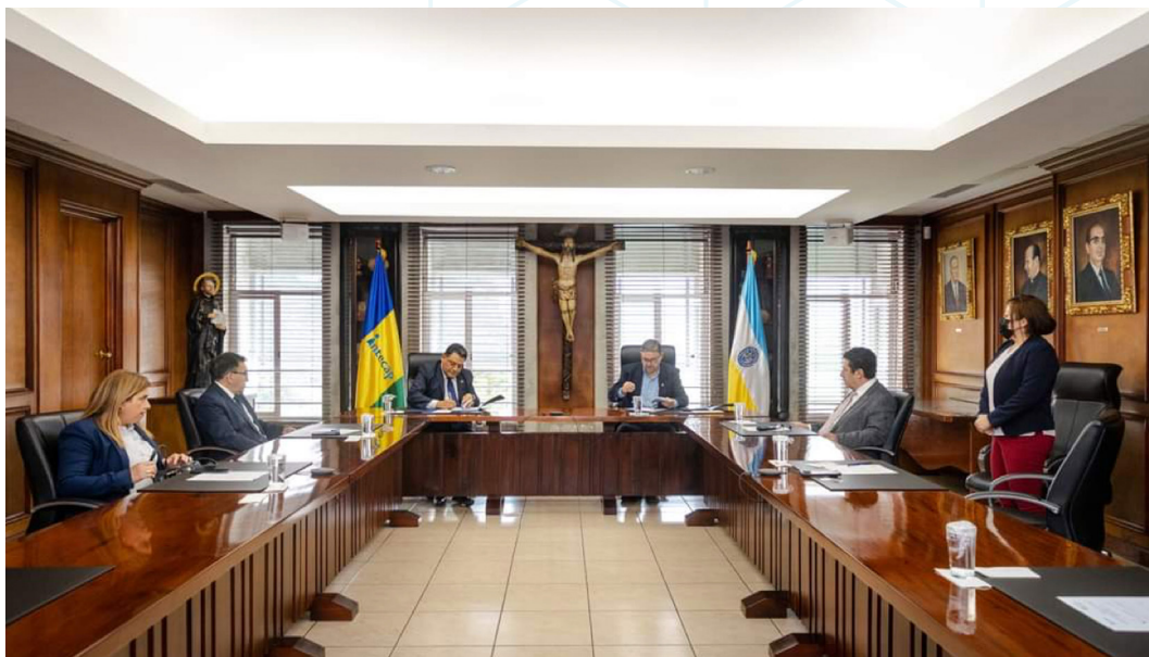
Figura 12. Autoridades de la Universidad Rafael Landívar e Intecap (1).