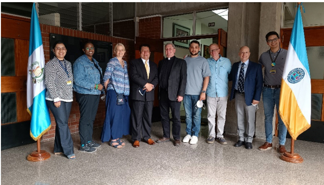
Figura 13. Participantes en el encuentro entre la Facultad de Ciencias de la Salud y Regis University (1).