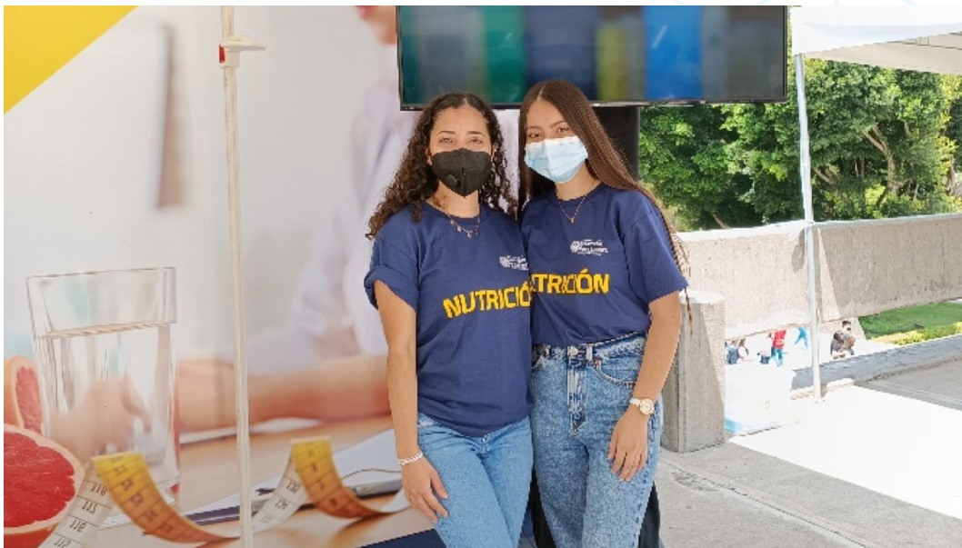
Figura 6. Estudiantes voluntarias de la Licenciatura en Nutrición brindan información a aspirantes (1).