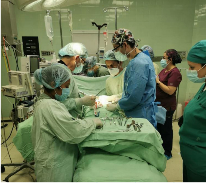
Figura 15. Estudiantes de la Licenciatura en Medicina llevando a cabo sus prácticas en el Centro Médico Militar, ciudad de Guatemala (1).