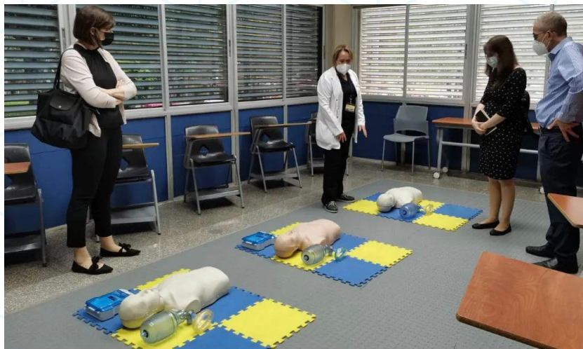
Directivos de Texas Children's Hospital visitan la Universidad en vías de un nuevo convenio de cooperación