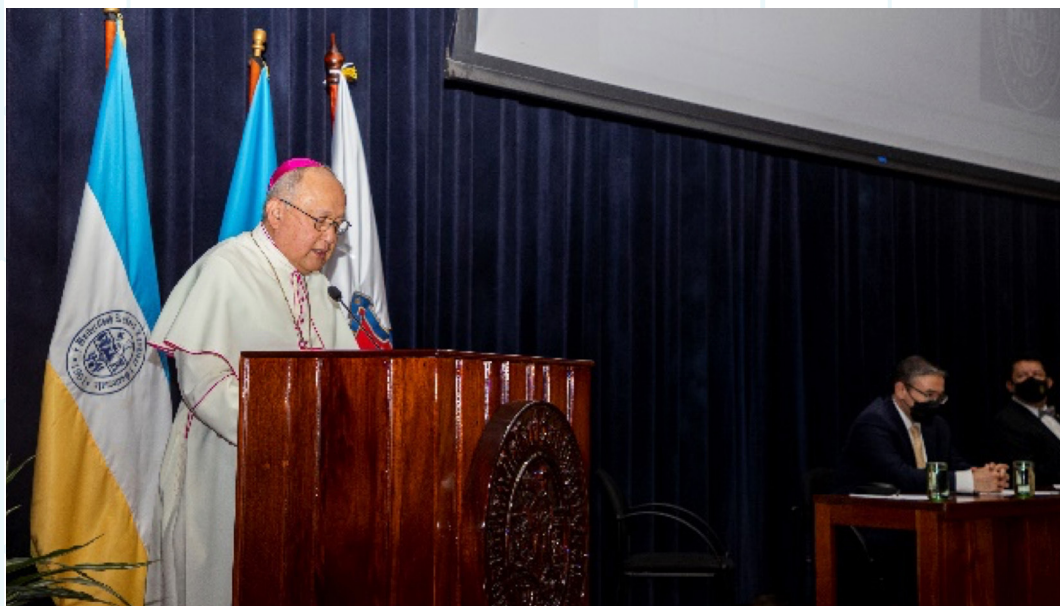
Figura 3. Su excelencia reverendísima, monseñor Francisco Motecillo Padilla, nuncio apostólico en Guatemala, participa de la cátedra inaugural (1).