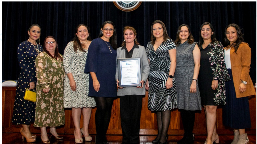
Figura 19. Equipo del Departamento de Nutrición participa en el evento de reacreditación de la licenciatura (1).