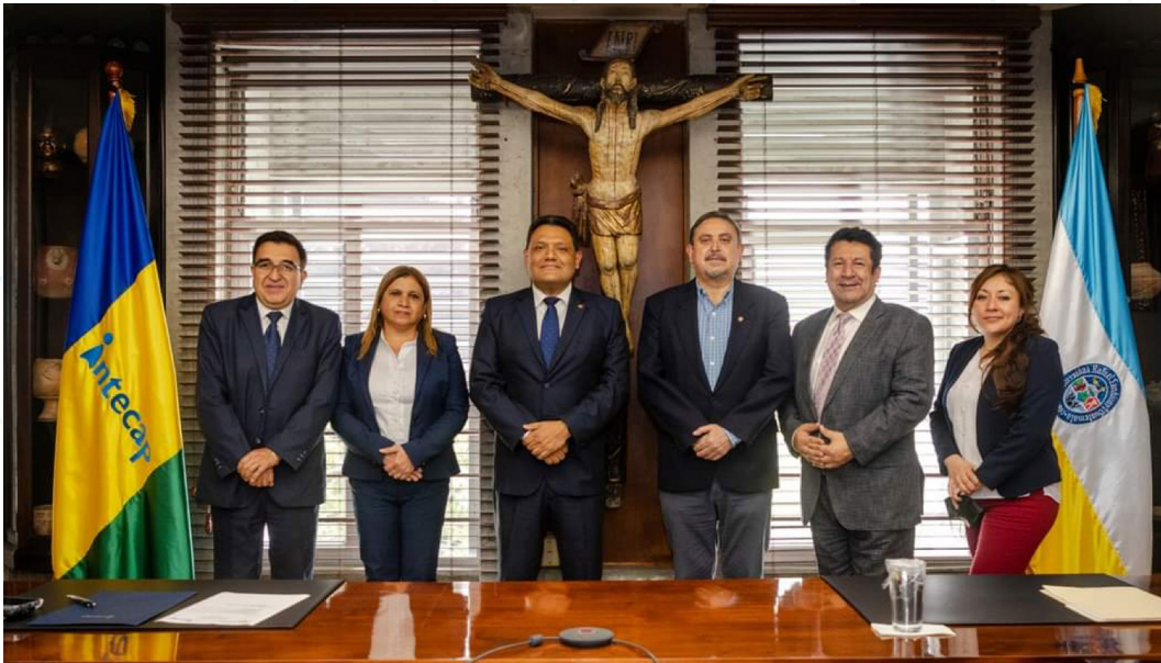
Figura 11. Autoridades de la Universidad Rafael Landívar e Intecap (1).