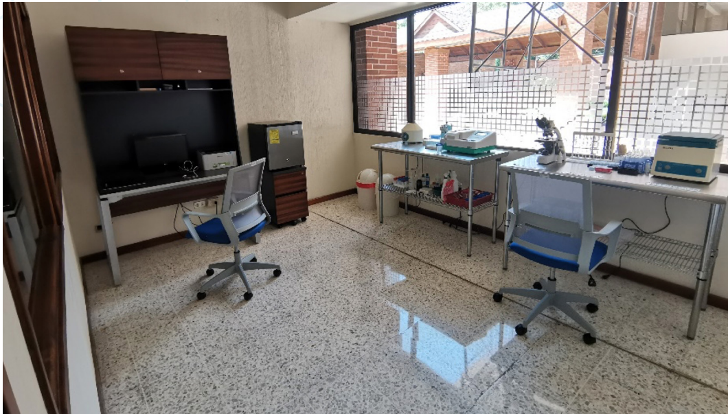
Figura 23. Avances en la construcción de espacios para atención de pacientes en diferentes especialidades (1).