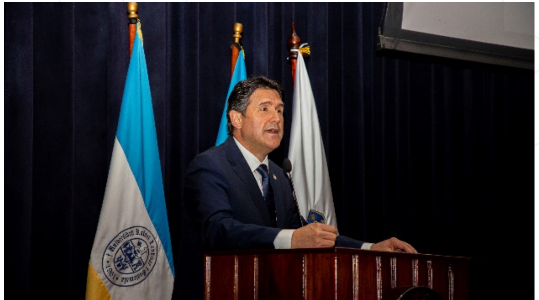
Figura 2. Alcalde de la ciudad de Guatemala, Ricardo Quiñonez, participa de la cátedra inaugural (1).