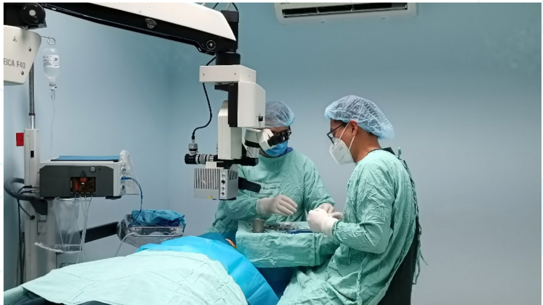
Figura 16. Estudiantes de la Maestría en la Subespecialidad de Córnea, Segmento Anterior y Cirugía Refractiva llevando a cabo sus prácticas en la Unidad Nacional de Oftalmología (1).