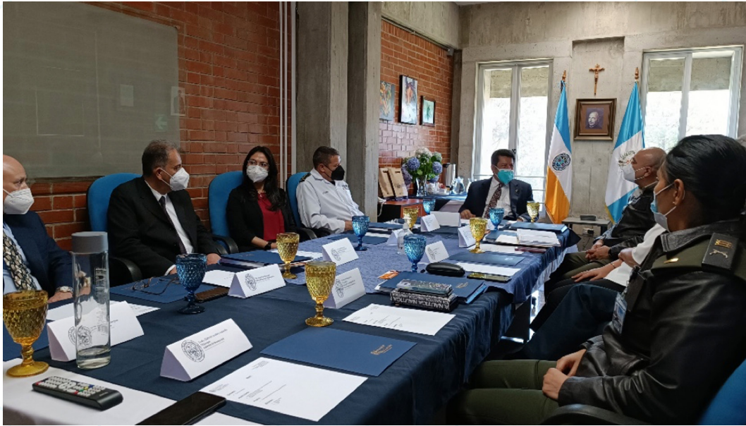
Figura 5. Autoridades de la Facultad de Ciencias de la Salud y el Centro Médico Militar en el Campus San Francisco de Borja, S. J., Universidad Rafael Landívar (1).