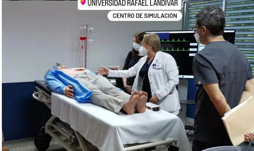
Figura 21. Directivos de Texas Children's Hospital, Estados Unidos, conocen el Laboratorio de Terapia Respiratoria y el Centro de Simulación de la Facultad de Ciencias de la Salud, Universidad Rafael Landívar (1).