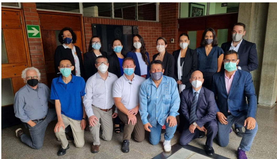
Figura 24. Miembros de Operación Sonrisa Internacional, Guatemala, junto con autoridades de la Facultad de Ciencias de la Salud, Universidad Rafael Landívar (1).

Visita de directivos de Operación Sonrisa Internacional a la Facultad de Ciencias de la Salud en seguimiento a proyectos de cooperación entre ambas instituciones, 16 de julio del 2022